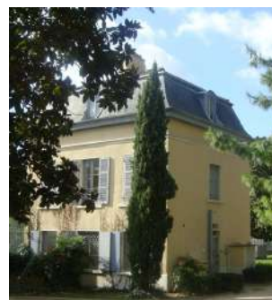
Maison de l'Économie Circulaire (M.E.C.)