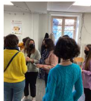
Atelier « consommation durable » en partenariat avec l'association Bellebouffe

En une année, grâce à cette organisation, nous avons élargi notre cercle d'adhérents. En un an, nous sommes passés de 5 à 21 adhérents.